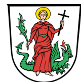
Ludwig Reger Erster Bürgermeister